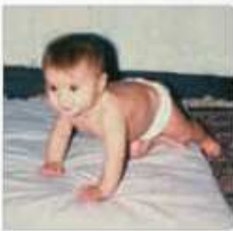
چهار دست و پا راه رفتن

ابتدایی‌ترین و شاخص‌ترین جنبه رشد، رشد جسمانی - حرکتی است. از زمان تولد تا نوجوانی، رشد جسمانی - حرکتی با سرعت و تغییرات بسیاری همراه است.