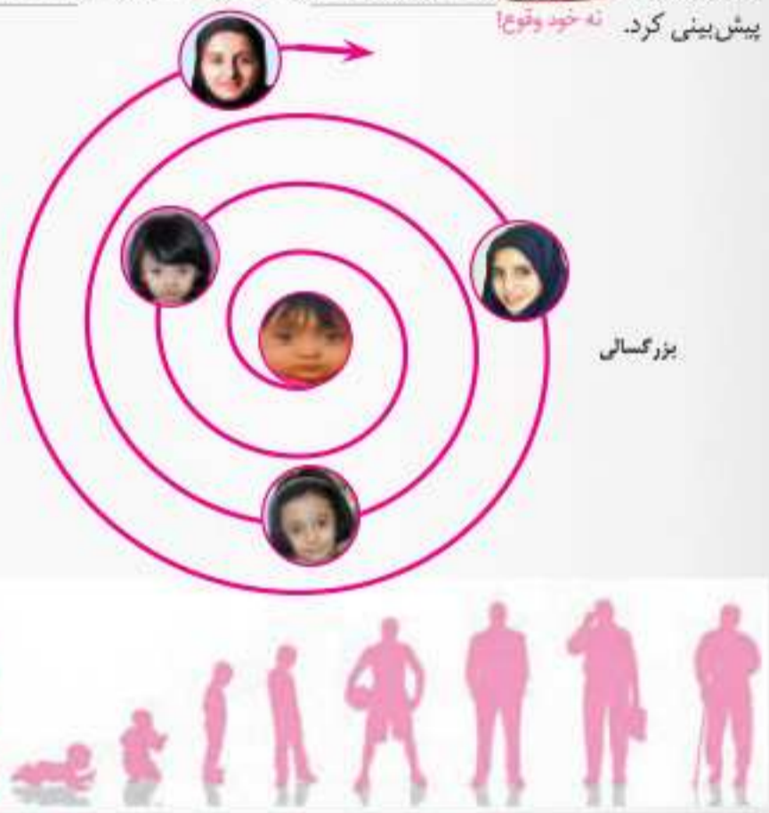
ریش اسم مصدر «رسیدن» است مانند گماش، گزینش ۱- Maturation

۶ در روان‌شناسی به رفتارهایی که وابسته به آمادگی زیستی است « ریش یا پختگی » گویند. تعریف دوم: ریش یا پختگی به معنای آن دسته از تغییراتی است که به آمادگی زیستی وابسته است و با گذشت زمان طبق یک برنامه طبیعی انجام می‌گیرد. عوامل محیطی نیز می‌توانند تا حدودی بر ریش یا پختگی تأثیر بگذارد. براساس فرایند ریش، آدمی، از دوره جنینی تا مرگ، برخی خصوصیات را در جنبه‌های مختلف رشد نشان خواهد داد. مثلاً از لحاظ رشد جسمانی به طور میانگین، کودک در ۱۵ ماهگی بدون کمک می‌تواند راه برود یا به طور میانگین، نوجوان در ۱۱ تا ۱۴ سالگی به بلوغ می‌رسد. از آنجا که وراثت نقش تعیین‌کننده‌ای در ریش یا آمادگی زیستی افراد برای تغییرات دارد، در بسیاری از موارد با توجه به بررسی خصوصیات افراد فامیل نزدیک و دور می‌توان احتمال وقوع برخی از ویژگی‌های رفتاری و شناختی را در دامنه‌های سنی خاص پیش‌بینی کرد. نه خود وقوع!