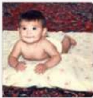
سینه خیز رفتن نوزاد