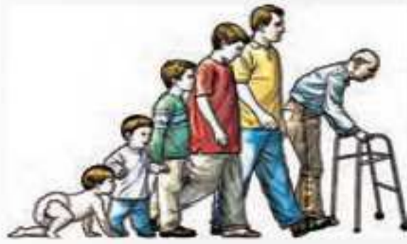
جدول ۱-۲- مراحل رشد انسان بعد از تولد