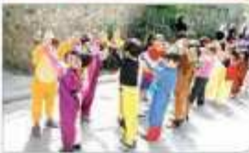
۱- Social Development