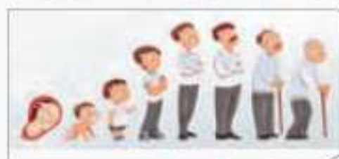
تعریف اول روان‌شناسی رشد

روان‌شناسی رشد، به عنوان یکی از گرایش‌های روان‌شناسی، به این‌گونه سؤالات پاسخ می‌دهد.