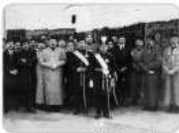
احمدشاه قاجار به همراه رضاخان و رجال دریاری

در نتیجه این دلایل، مأموران انگلستان در ایران تصمیم گرفتند تا شخص مورد اعتماد خود را به حکومت برسانند تا از طریق او بتوانند به صورت غیر مستقیم اهداف خود را در ایران پیاده کنند.