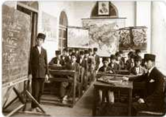
رضاشاه دانش‌آموزان را هم به استفاده از کلاه پهلوی مجبور کرد.

رضاشاه به نام تمدن و تجدد و مبارزه با کهنه‌پرستی به یک شکل کردن لباس‌ها و برداشتن حجاب بانوان اقدام کرد. از نظر رضاشاه مهم‌ترین راه پیشرفت و توسعه کشور، تقلید از غرب و اشاعه فرهنگ غربی است ← به تقلید از آنتونورک (رئیس‌جمهور ترکیه) به مبارزه با همه سنت‌های اسلامی پرداخت.